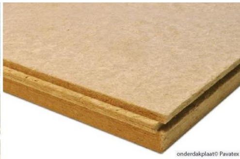
Houtwol sarkingplaten en onderdakplaten