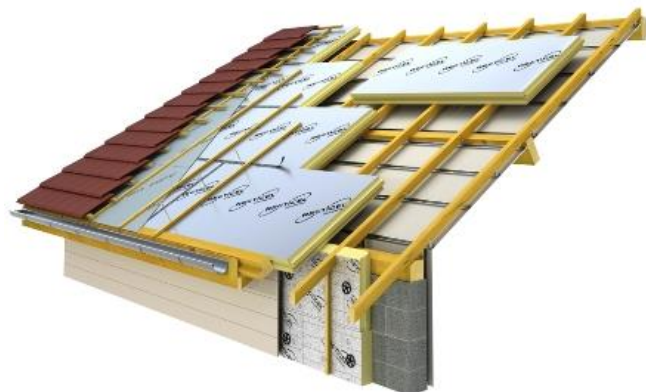
Koudebrugvrije opbouw (afbeelding: Recticel)

Bij een sarking-systeem kunnen koudebruggen eenvoudiger vermeden worden. De aansluiting van de muurisolatie met de dakisolatie verloopt een stuk eenvoudiger en bij een sarkingdak met doorlopende isolatieplaten wordt de isolatieschil ook niet onderbroken door houten kepers. Bij de sandwichpanelen met ingewerkte spanten geldt dit laatste voordeel niet.